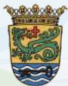
AYUNTAMIENTO DE PUERTO DE LA CRUZ